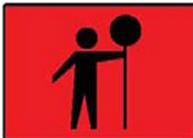
前方有交通督導員，準備停車。