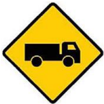
小心進入道路的行駛緩慢的車輛。