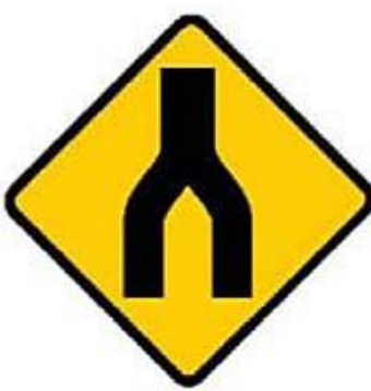
分叉道路於前方終止