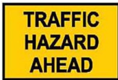
這標誌在前方道路發生如路面有大量漏油、大樹倒下、下雪或崩塌等臨時緊急情況時使用。