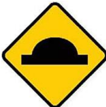
前方路面有凸起物