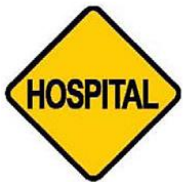
前方有醫院，小心駕駛。