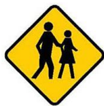
前方可能有行人過路。