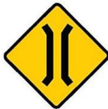
前方有窄橋，準備停車。