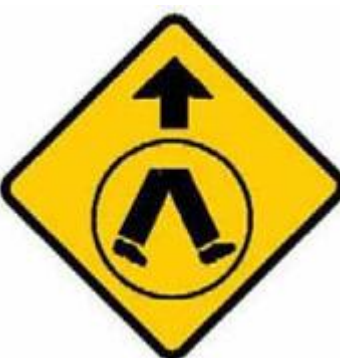
前方有行人過路處。